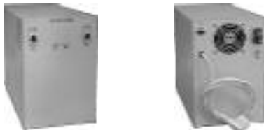
Рисунок 1. Внешний вид ИБП

4.1 Конструктивно источник питания выполнен в виде настольного (напольного) блока со съемным кожухом (см. рисунок 1).