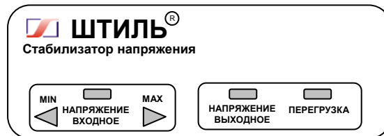
Рисунок 4.1 Передняя панель стабилизатора

На одной боковой стенке стабилизатора расположена розетка с заземляющим контактом для подключения нагрузки, а на другой – автоматический предохранитель 2А (у стабилизатора R250T) или 5А (у стабилизаторов R400T – R800T), выключатель СЕТЬ и выведен сетевой шнур для подключения стабилизатора к сети.