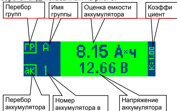
Рис.4. Вид экрана при просмотре записанных измерений.

После входа в этот пункт меню дисплей приобретет вид, показанный на рис. 5.