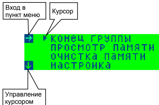
Рис. 4. Главное меню Кулона-12/6т.

Главное меню Кулона-12/6т состоит из четырех пунктов. Вид главного меню приведен на рисунке 4.