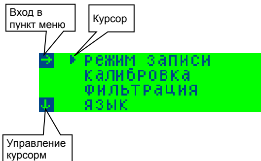
Рис. 5. Меню настройки Кулона-12/6т.