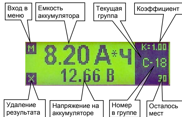
Рис. 2. Дисплей прибора в режиме записи результата по умолчанию

На рис.2 показан вид дисплея прибора в режиме записи по умолчанию.