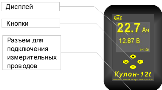
Рис.1 Внешний вид Кулона-12t

В случае, если по каким-то причинам прибор не может определить емкость, на дисплее индицируются сообщения, которые могут сопровождаться звуковыми сигналами (часть сообщений также может быть записана).