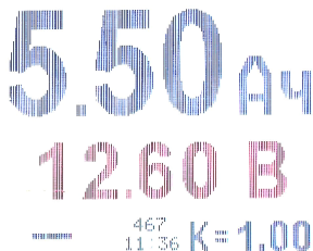
рис. 4. Дисплей прибора в режиме записи результата по команде.

В этом режиме работы прибора на дисплее не отображается номер измерения и группа (поскольку результат не был записан).